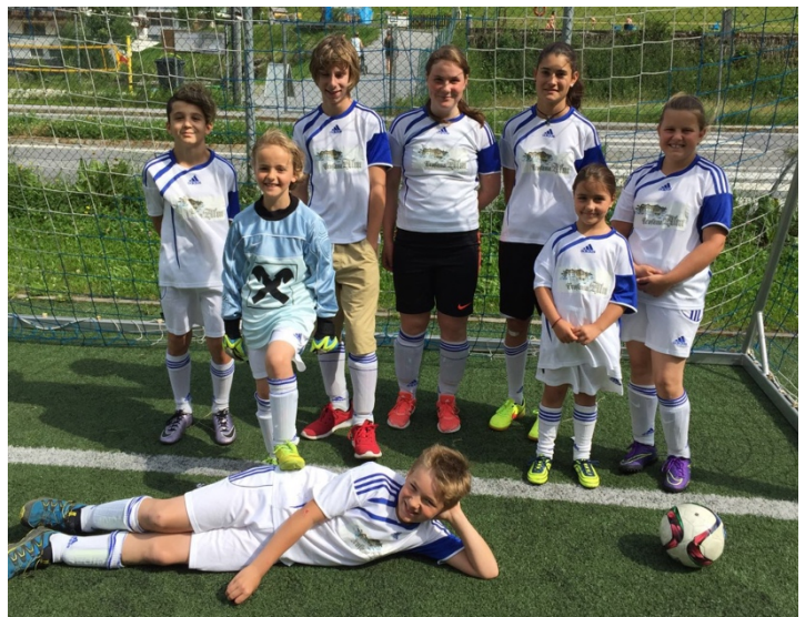
Kinderteam: 1. Platz