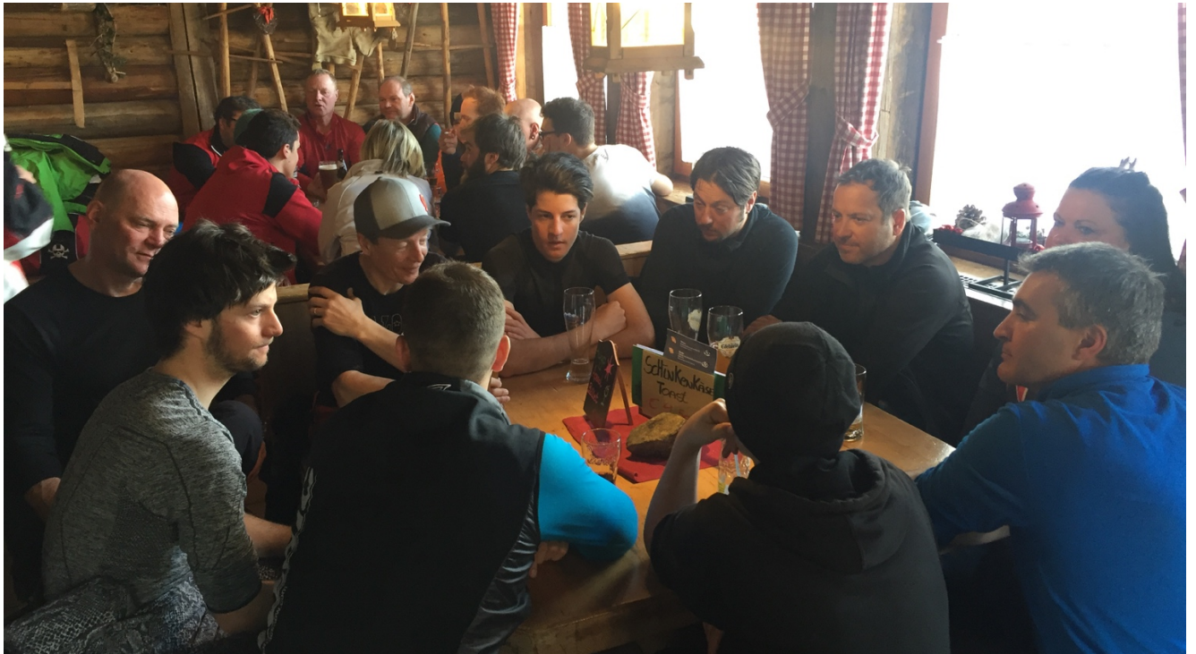
SG-Weißwurstparty im Putzloch