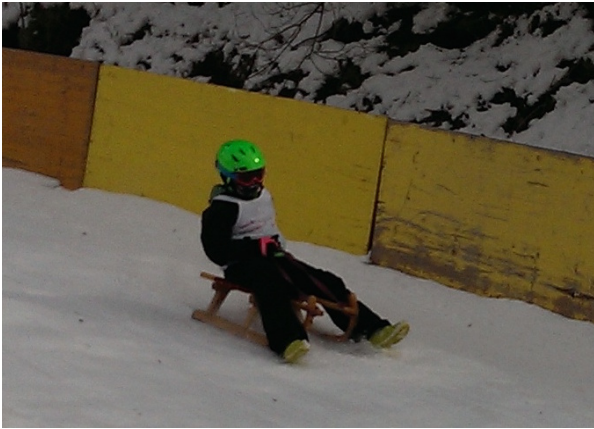
Vereinsrodelrennen, 1. Platz: