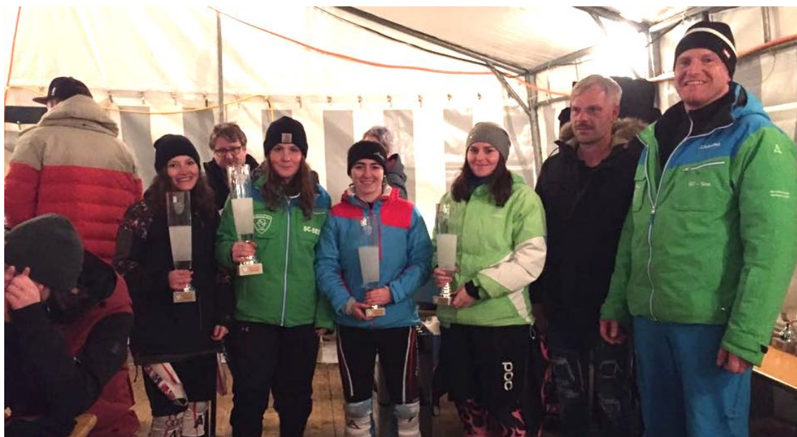
Siegerfoto Damen Parallelsalom 2018