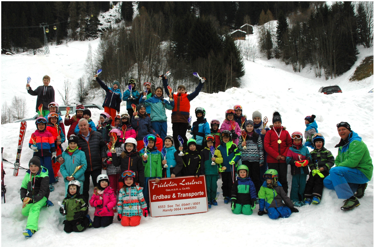
Gruppenfoto Ortskinderrennen 2017/18