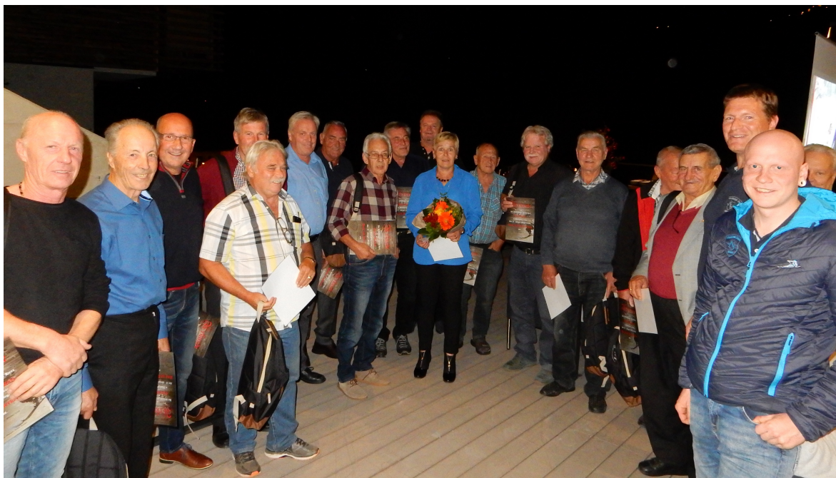
Ehrung: 50 Jahre und länger beim Schiclub

Am 13. Oktober 2018 feierten wir das 60 Jahr-Jubiläum unseres Clubs, bei dem alle Mitglieder unseres Clubs eingeladen waren. Dieser Anlass wurde auch genutzt um unsere langjährigen Mitglieder zu ehren und für ihre jahrelange Unterstützung ein kleines Präsent zu überreichen. An dieser Stelle wollen wir uns nochmals bei allen für den schönen Abend im BWG bedanken.