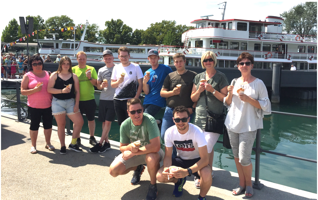
Nach erfolgter Schiffsfahrt gönnten wir uns noch ein leckeres Eis...

Im Sommer 2018 machten wir einen Tagesausflug nach Bregenz. Dort angekommen, besuchten wir via Gondelbahn den Aussichtsberg-Pfänder, auf dem uns der Wildpark erwartete bzw. zu Mittag ein leckeres Mittagessen. Wieder unten angekommen bekundeten wir die Bregenzer Gegend von einer Schiffsfahrt aus. Anschließend suchten wir eine Go-Kart Bahn hinter der Staatsgrenze in der Schweiz auf und dabei lieferten sich vor allem die Jungs das ein oder andere heiße Battle um das begehrte Siegerpodest. Abgeschlossen wurde der ereignisreiche Tag mit einem gemütlichen Abendessen in der Schattenburg in Feldkirch.