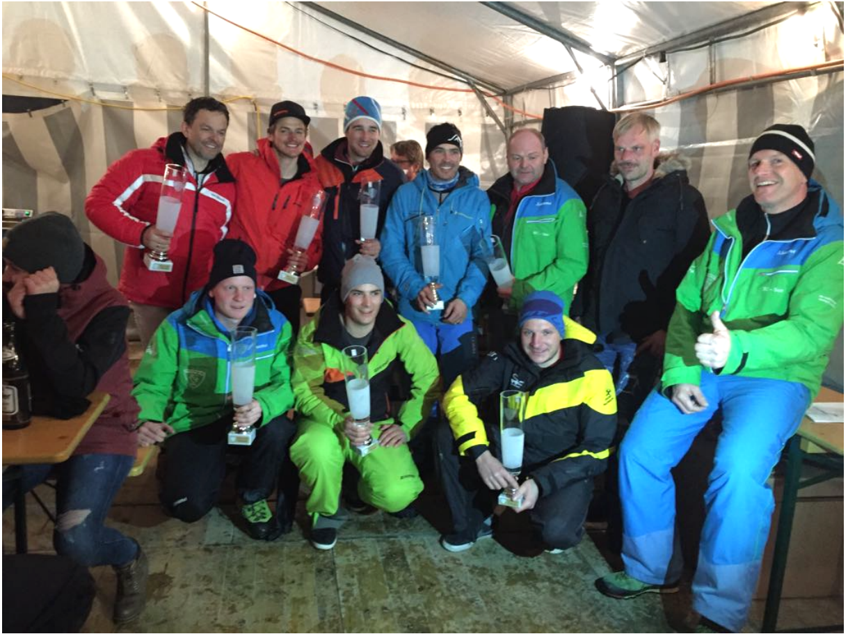
Siegerfoto Herren Parallelslalom 2018