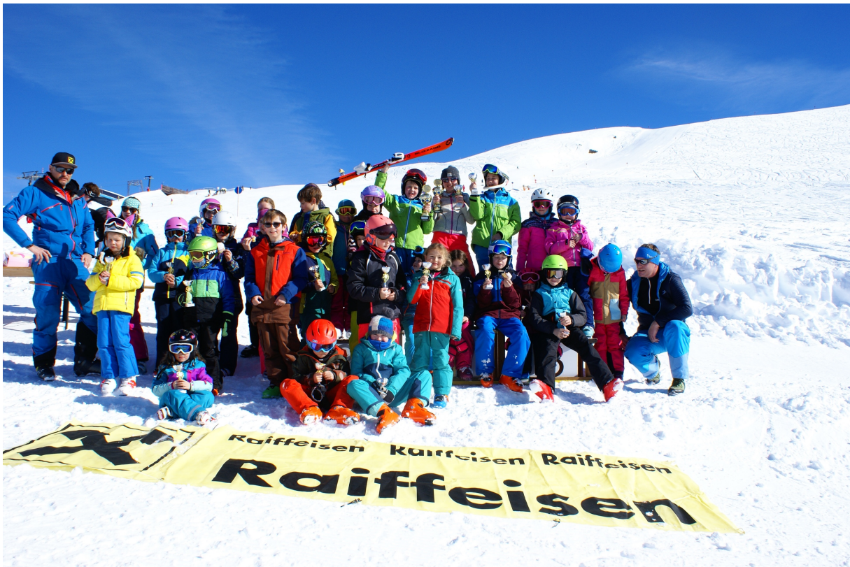
Siegerfoto Ortskinderrennen 2018/19