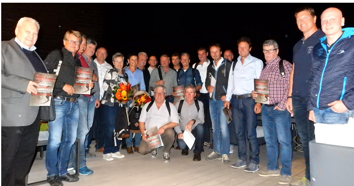
Ehrung: 40 Jahre und länger beim Schiclub